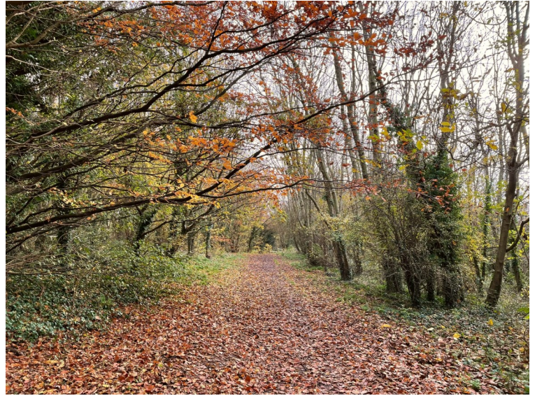
Comin y Felin, Hydref 2024

Mae Comin y Felin, coetir gwerthfawr yng nghanol Magwyr a Gwndy, ar fin mynd trwy brosiect adfer trawsnewidiol gyda'r nod o wella ei iechyd ecolegol, hygyrchedd a gwerth cymunedol. Bydd y fenter hon, a gefnogir gan y Grant Buddsoddi mewn Coetiroedd (TWIG) a weinyddir gan Gronfa Dreftadaeth y Loteri Genedlaethol ar ran Llywodraeth Cymru, yn gwasanaethu fel safle blaenllaw ar gyfer Coedwig Genedlaethol Cymru ac mae'n addo adnewyddu'r man gwyrdd hanfodol hwn ar gyfer cenedlaethau'r dyfodol.