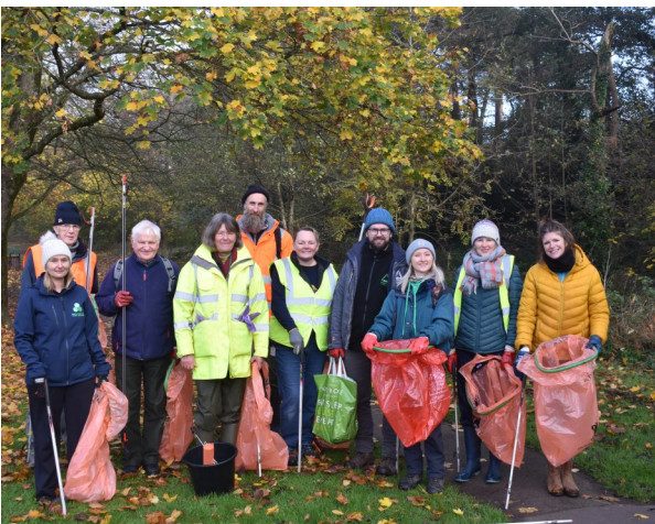
Casglu Sbwriel Afon Gafenni

Rydym yn gobeithio gallu dychwelyd yn yr haf pan fydd y llif dŵr yn llai pwerus a lefelau dŵr yn is, er mwyn cael gwared ar sawl troli archfarchnad sydd yn yr afon. Rydym hefyd yn edrych i mewn i gael gwared â Jac y Neidiwr ar hyd Afon Gafenni gyda'n Partneriaid.