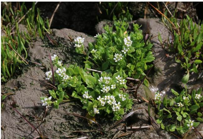
Scurvy Grass Lloegr