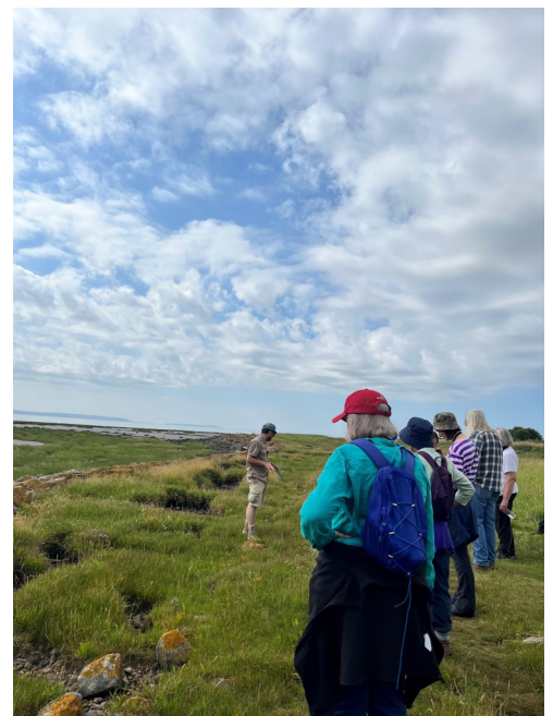
Ymchwilio i'r parth rhynglanwol