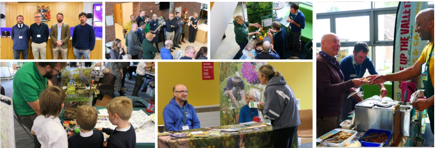
Lluniau o'r Digwyddiad Dathlu Natur a Bwyd Cynaliadwy

Hoffem estyn diolch yn fawr i holl aelodau'r PNL a oedd wedi cymryd rhan yn y diwrnod.