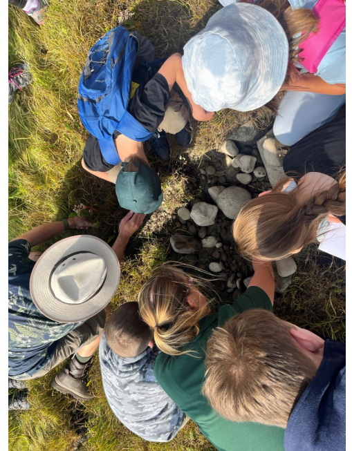
Grŵp Ieuencid GWT

Nod y prosiect Tu Hwnt i'r Morglawdd yw codi ymwybyddiaeth, dealltwriaeth a gwerthfawrogiad o barth rhynglanwol helaeth Aber Afon Hafren sy'n ffinio â Gwastadeddau Gwent. Gyda chymorth y naturiaethwr Ed Drewitt, gwnaethom gynnal cyfres o weithdai a ddysgodd bwysigrwydd yr amgylchedd unigryw hwn a'r fioamrywiaeth anhygoel y mae'n ei gynnal.