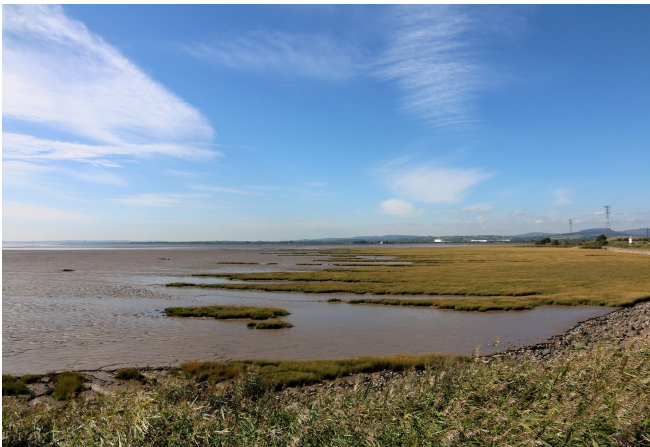
Morfa heli o Wlyptiroedd Casnewydd

A oes gennych chi ddi-ddordeb mewn dysgu mwy am Fôr Hafren neu eisiau cymryd rhan mewn gwyddoniaeth dinasyddion? I'ch helpu i blymio'n ddyfnach, rydym wedi datblygu pecyn adnoddau cynhwysfawr sy'n cynnwys gwybodaeth am hanes y dirwedd, cynefinoedd a rhywogaethau allweddol a chanllaw i gofnodi bywyd gwyllt. Mae'r llyfryn ar gael i'w lawrlwytho ar gyfer ein gwefan drwy ddilyn y ddolen isod