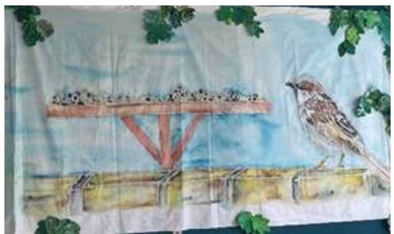
Panel trefol Sir Fynwy