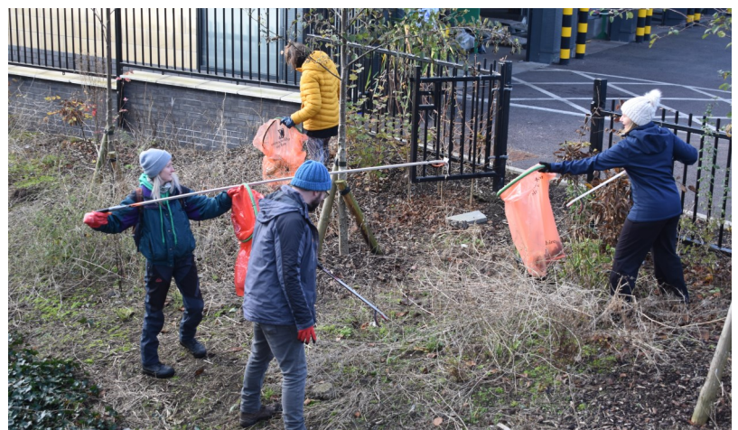
Gwaith tîm yn helpu ysgafnhau'r baich